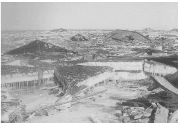
1952 年十勝沖地震（浜中村霧多布）：破壊された家屋と流水